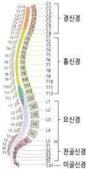
<척수신경의 구조 및 피부분절>